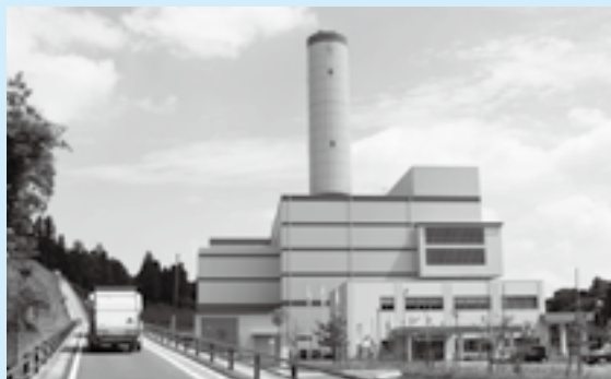
小泉にある成田富里いずみ清掃工場