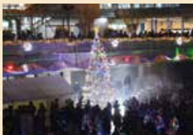
夜にはライトアップも

日時=12月9日(土) 午前10時~午後6時30分 会場=成田空港第2旅客ターミナルビル前中央広場 内容=アーティストライブ、抽選会、模擬店、周辺市町の子どもたちが飾り付けたミニツリーの展示など ※くわしくはクリスマス・フェスティバル実行委員会事務局(NAA地域共生部・☎34-5858)へ。