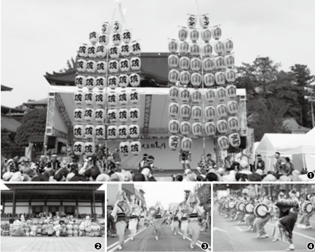
① 妙技を披露する「秋田竿燈まつり」② ご当地キャラが新勝寺に集合③ 表参道をパレードする「阿波おどり」④ 和太鼓を打ち鳴らす「盛岡さんさ踊り」

市内をはじめ、県内外から伝統芸能団体が集まり、多彩な祭りや踊り、獅子舞などを披露する「成田伝統芸能まつり」が9月16日(土)・17日(日)に開催されます。また、全国各地のキャラクターが集まる「ご当地キャラ成田詣」も同時開催されます。