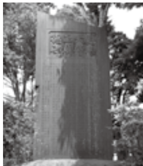
左上/宗吾霊堂門前の大火(明治43年9月)、左下/建設中の宗吾霊堂本堂(大正5年10月)(宗吾霊堂所蔵) 上/田中照心碑(場所:宗吾霊堂境内)

宗吾霊堂では、佐倉宗吾の命日(9月3日)にちなんで、9月2日(土)・3日(日)に秋の例大祭「御待夜祭」が行われます。境内には露店が並び、町内では屋台が曳き廻されます。