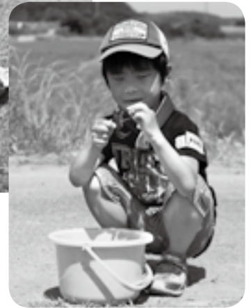
大きいのが釣れたね