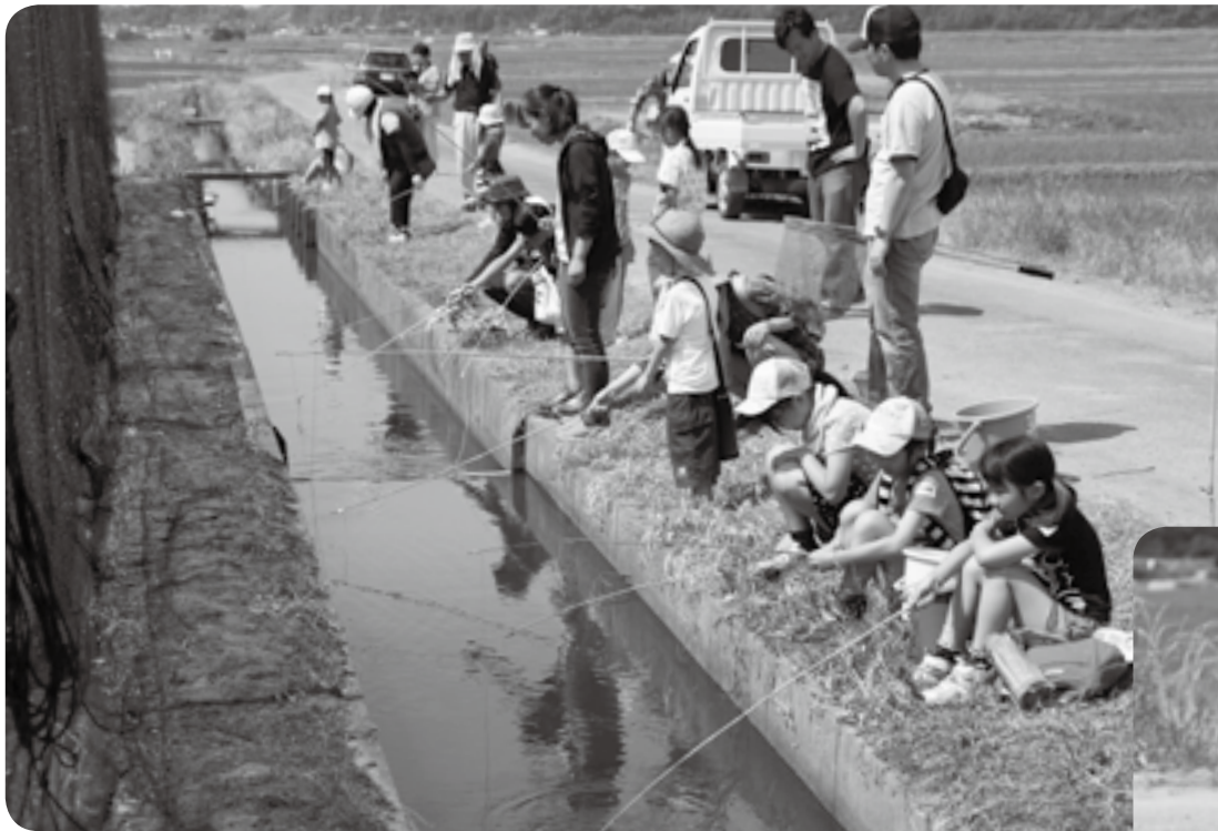
釣り上げるタイミングを狙って