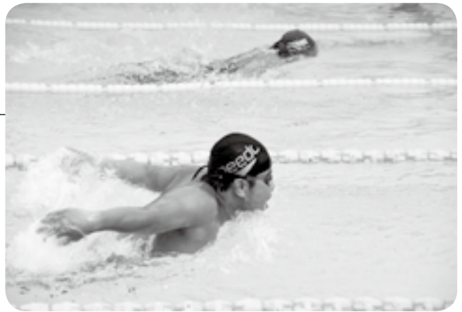
ベストを尽くして泳ぐ

市内の小中学生が普段の練習の成果を発揮し、自己新記録を目指す「水泳記録会」が大栄B&G海洋センターで行われました。平泳ぎ・背泳ぎ・バタフライ・自由形などの種目でタイムを計測。家族や仲間に見守られながら、それぞれの種目に取り組みました。選手たちは新記録が出ると喜びの声を上げ、自身の成長を実感しているようでした。