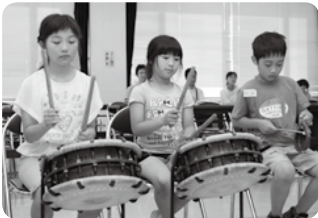
小太鼓やかねをたたく