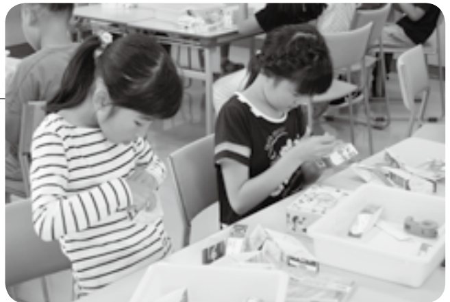
牛乳パックを使ってばね作り

日頃の感謝の気持ちを伝えるため、「お父さんにびっくりプレゼントをつくろう」が子ども館で開催されました。箱を開けると中身が飛び出すプレゼントや感謝状作りが行われました。子どもたちは、牛乳パックを使ってばねを作ったり、シールで箱に装飾したりしました。また、上級生が下級生の手伝いをするなど、みんなで協力して思い思いのプレゼントを完成させました。