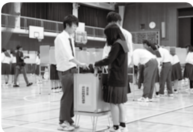
真剣な面持ちで投票