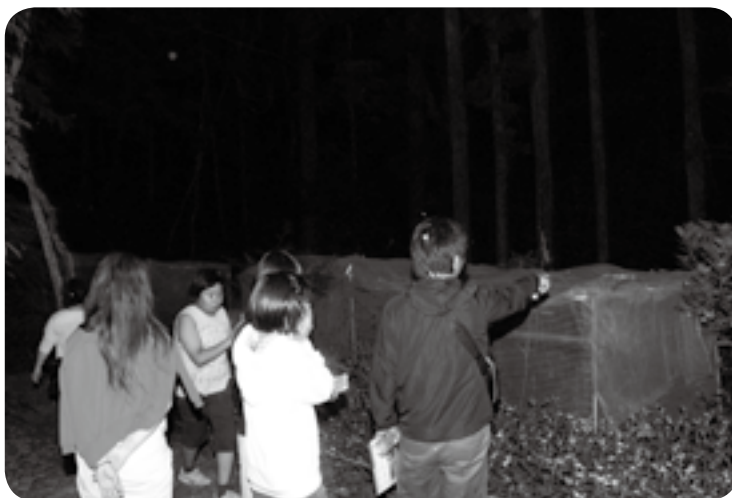
向こうにホタルがいる

んでくると次々と釣り上げて、満足そうな笑みを浮かべていました。釣りが終わった後は、下方地区の人が用意してくれた、ゆでたえびがにを試食。初めて食べたという子どもたちは「エビみたいでおいしい」と言いながらたくさん食べていました。