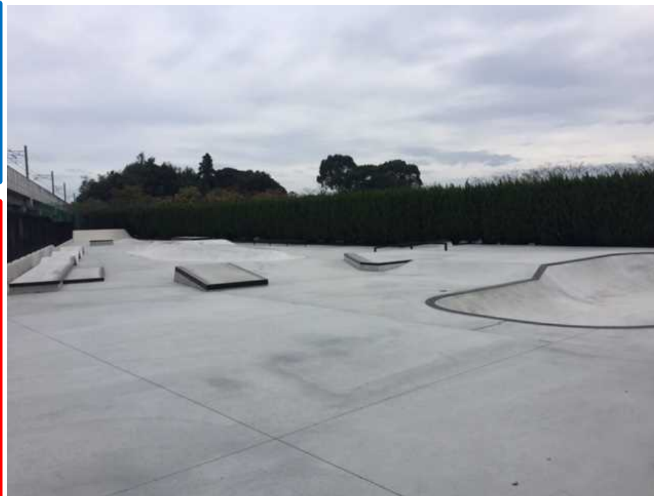
スケートボードパーク(大谷津運動公園内)