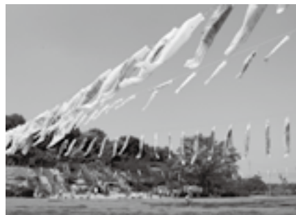
悠々と泳ぐこいのぼりの群れ