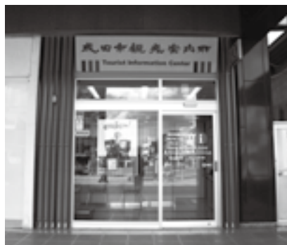
JR成田駅舎内の観光案内所