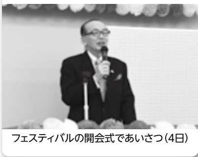
フェスティバルの開会式であいさつ(4日)