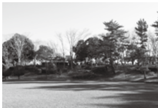
新たに登録された松ノ下近隣公園

良好な景観を望むことができる場所を「なれた景観資産」として登録しています。平成28年度は新たに、「松ノ下近隣公園の自然林の景観」「旧学習院初等科正堂と森林の景観」の2カ所を登録しました。