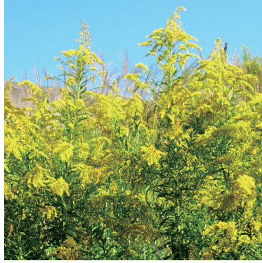
2. セイタカアワダチソウ