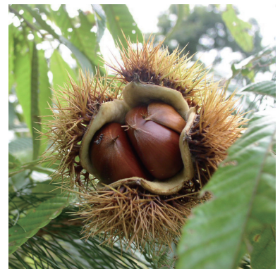
8. クリ (実)