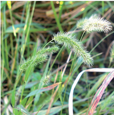
4. エノコログサ (ネコジャラシ)