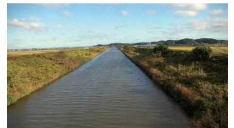
根木名川のようす