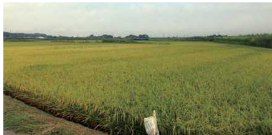
上空にトンボが飛ぶ刈取り前の田んぼ