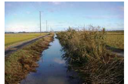
根木名川のようす