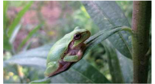
ニホンアマガエル