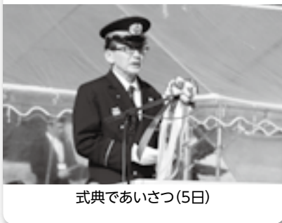
式典であいさつ(5日)