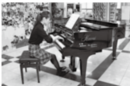
重厚な音を楽しんで