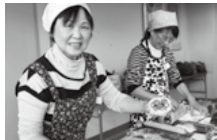
出来栄に思わず笑みが