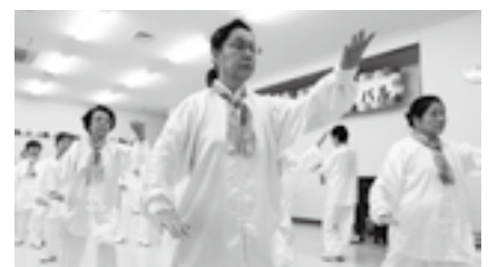
そろいの衣装で太極拳の演武

※鑑賞を希望する人は当日直接会場へ。くわしくは同センター(☎26-0236)へ。