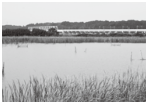
美しい印旛沼を守ろう