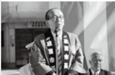
記念イベントであいさつ(28日)