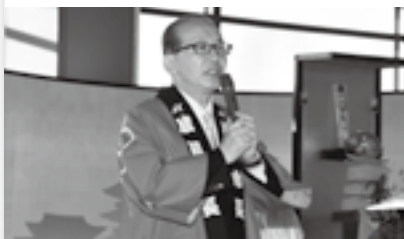
祈願祭であいさつ(1日)