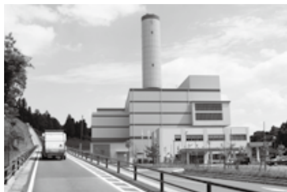
小泉にある成田富里いずみ清掃工場