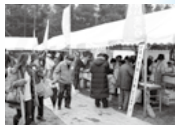
多くの人でにぎわう模擬店

※くわしくは大栄ふるさとふれあいまつり実行委員会事務局(☎090-3200- 5698)へ。