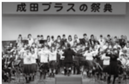
生演奏の迫力を感じて

※入場は無料です。くわしくは国際文化 会館(☎23-1331、月曜日、祝日の翌 日は休館)へ。