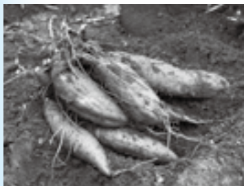
サツマイモがたくさん

※くわしくは日本一のいも掘り広場実行委員会(JAかとり大栄経済センター・ ☎73-2988)へ。