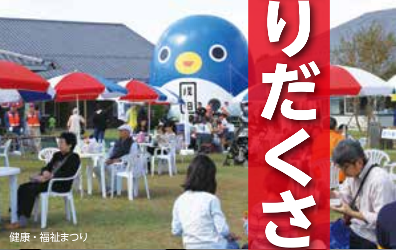
健康・福祉まつり