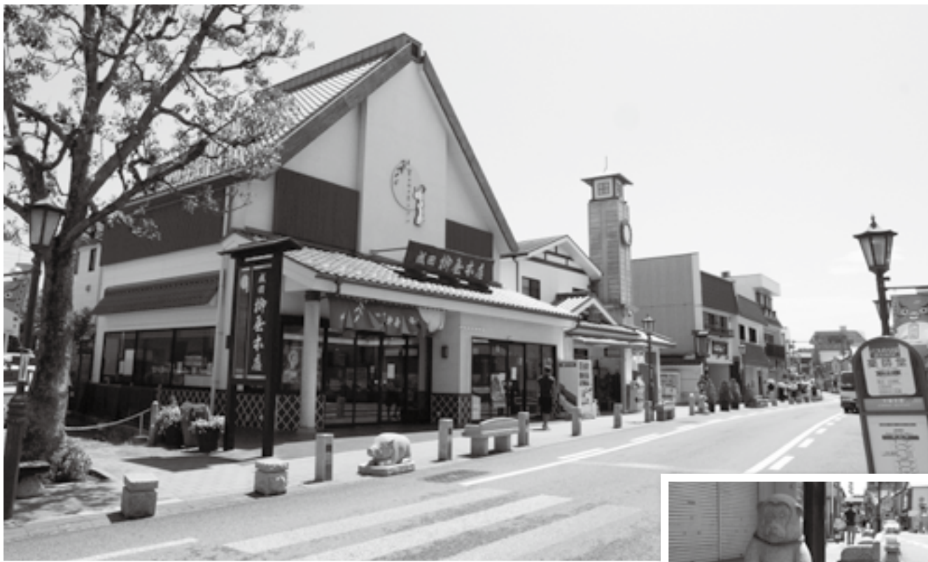
歩道が拡張された表参道

豊かな自然、歴史ある寺社や街並み、国際空港など、多様な景色・眺め(景観)が楽しめる成田市。市では「成田らしさを感じられ、良好な景観を望める場所」を市民共有の宝物として保全・活用しようと、「なりた景観資産」として登録しています。ここでは、市民の皆さんから推薦され登録された、景観資産の数々を紹介します。