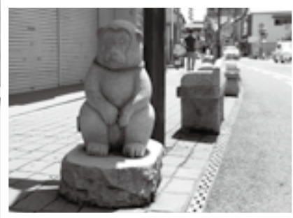
干支の石像がお出迎え

また、表参道の中ほどに差し掛かると、道の両脇には愛らしい干支の石像が訪れる人たちを迎えてくれます。すがすがしい秋の風を感じながら、表参道をゆっくりと散策して、あなたの干支を探してみたいはいかがですか。