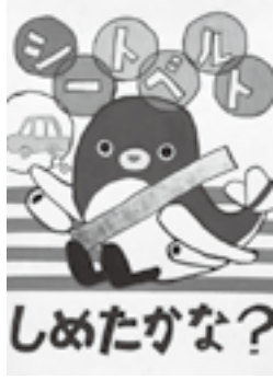
小学校低学年の部