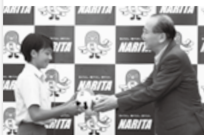
大会出場選手に記念品を贈呈(26日)