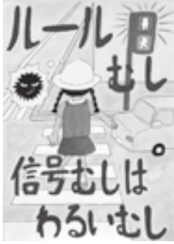
小学校高学年の部