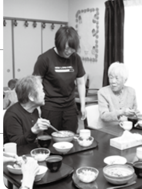
気心知れた職員と楽しく食事

市では、介護保険制度の下、高齢者が要介護状態となっても、安心して暮らせるよう、さまざまなサービスを用意しています。今回は、通いによるサービスを中心に、利用者の希望などに応じて、訪問や宿泊を組み合わせる「小規模多機能型居宅介護」など、地域密着型サービスについて紹介します。