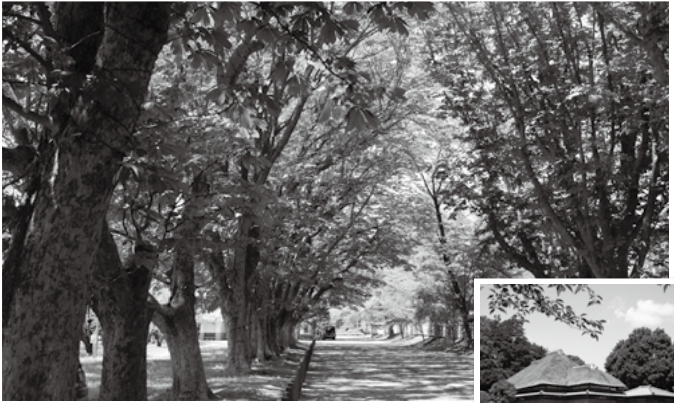
三里塚御料牧場記念館へと続くマロニエの並木道

豊かな自然、歴史ある寺社や街並み、国際空港など、多様な景色・眺め(景観)が楽しめる成田市。市では「成田らしさを感じられ、良好な景観を望める場所」を市民共有の宝物として保全・活用しようと、「なりた景観資産」として登録しています。ここでは、市民の皆さんから推薦され登録された、景観資産の数々を紹介します。