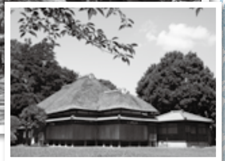
歴史あるかやぶき屋根の貴賓館