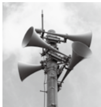
防災行政無線で放送

市では、防災行政無線が正常に 作動することを確認するために、 試験放送を1日2回(正午と夕方) 実施しています。