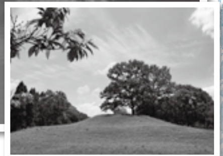
壮大で歴史を感じさせる船塚古墳