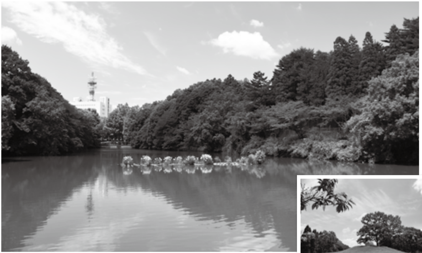
池や森林などの自然が残る赤坂公園

豊かな自然、歴史ある寺社や街並み、国際空港など、多様な景色・眺め(景観)が楽しめる成田市。市では「成田らしさを感じられ、良好な景観を望める場所」を市民共有の宝物として保全・活用しようと、「なりた景観資産」として登録しています。ここでは、市民の皆さんから推薦され登録された、景観資産の数々を紹介します。