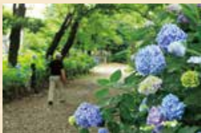
アジサイに囲まれて歩く

期間中の日曜日、午前10時～午後3時に、箏・尺八・二胡などの演奏やお茶会が開催されます。