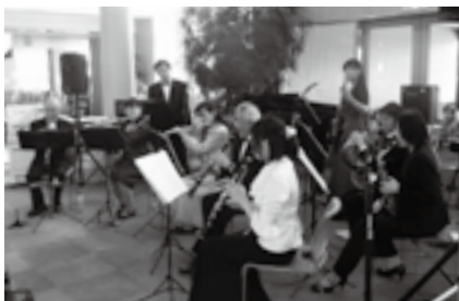
さまざまな楽器の音色が溶け合う

※入場は無料です。鑑賞を希望する人は当日直接会場へ。くわしくは生涯学習課(☎20-1534)へ。