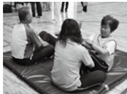
上体起こしに挑戦