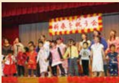
子どもたちが仲良く中国の歌を合唱