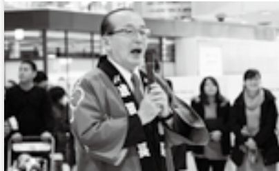
空の安全を祈願して(1日)