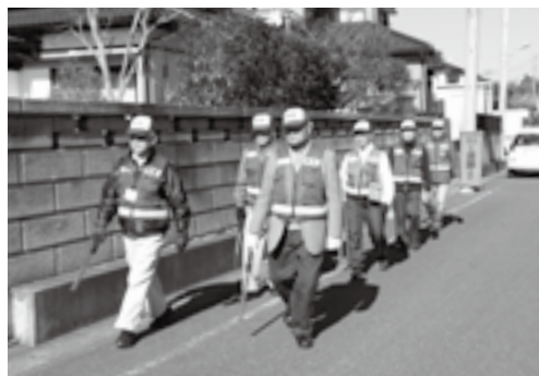
犯罪抑止につながる街頭パトロール