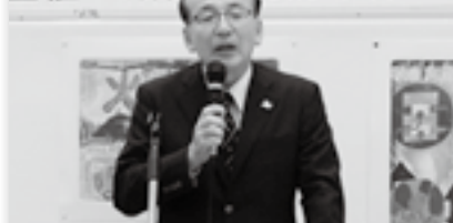
表彰式であいさつ(3日)