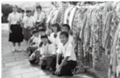
供えられた千羽鶴の前で

※入場は無料です。観覧を希望する人は当日直接会場へ。駐車場が少ないので公共交通機関を利用してください。くわしくは広報課国際交流室(☎20-1503)へ。