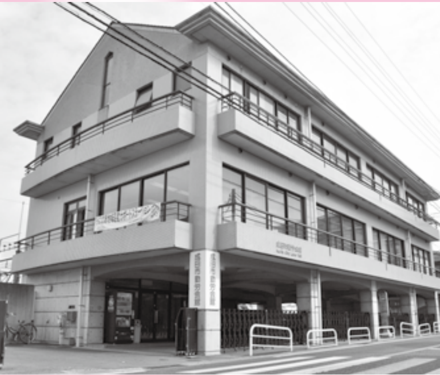
勤労会館の2階にあります

利用できる時間は、祝日を除く月～金曜日の午前10時～午後5時です。ぜひ活用してください。 ※くわしくは同ステーションへ。