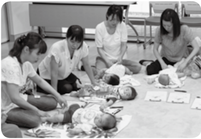
母親同士が和やかに談笑