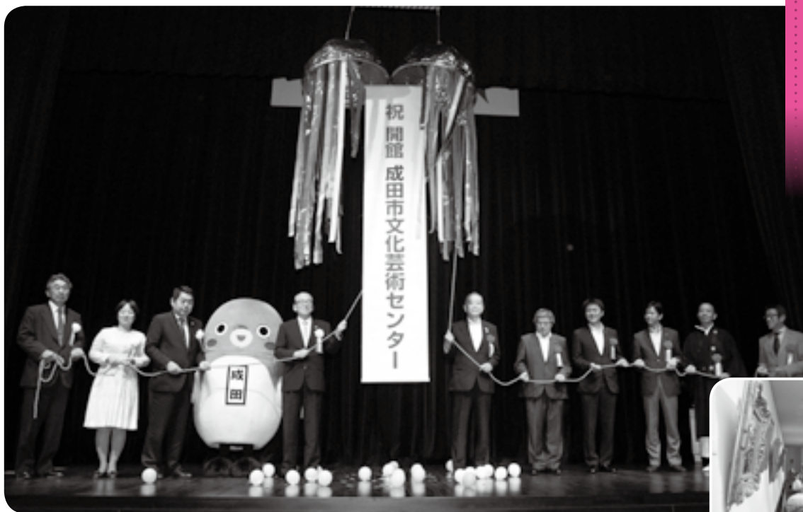
オープンを記念してくす玉割り