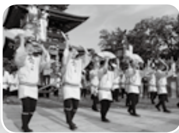
疲れを知らない若者たちの踊り