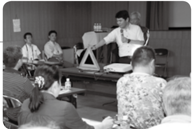
三角停止板を使った非常時の対処法を解説

高速道路の利用が増える時期を前に「夏休み直前ドラテク道場」が中央公民館で開催されました。参加者は、最近の事例から、事故を起こさないための心得や起こした際の対処法などを学びました。また、講師を務めたNEXCO東日本の職員から、深夜割引や休日割引など、高速道路をお得に利用する方法の紹介も。参加者の1人は「今日知った割引制度を利用したい」と、ドライブ旅行に胸を高鳴らせていました。