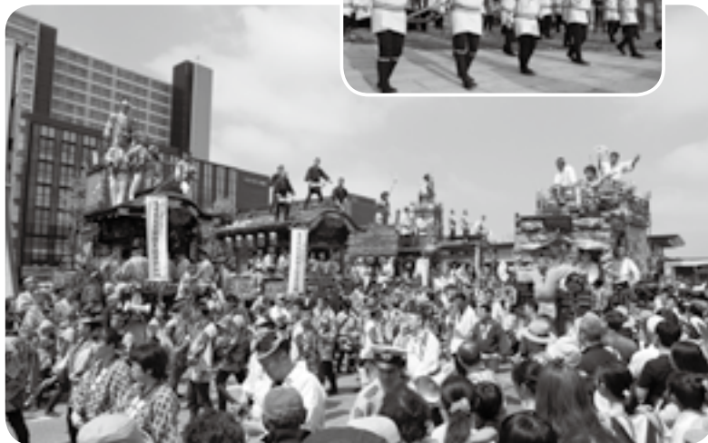
スカイタウン成田前に山車・屋台が集結

夏の成田を熱気と興奮で包む「成田祇園祭」が成田山新勝寺や表参道を中心に開催されました。10日の新勝寺大本堂前の総踊りを皮切りに、11日には、ことし完成したスカイタウン成田のあるJR成田駅前での総踊り、12日には総引き・総踊りなど見せ場が目白押し。期間中は晴天に恵まれ、炎天下での祭りとなりましたが、山車・屋台の引き手も、訪れたたくさんの観光客も、吹き出る汗をものともせず祭りを楽しんでいました。