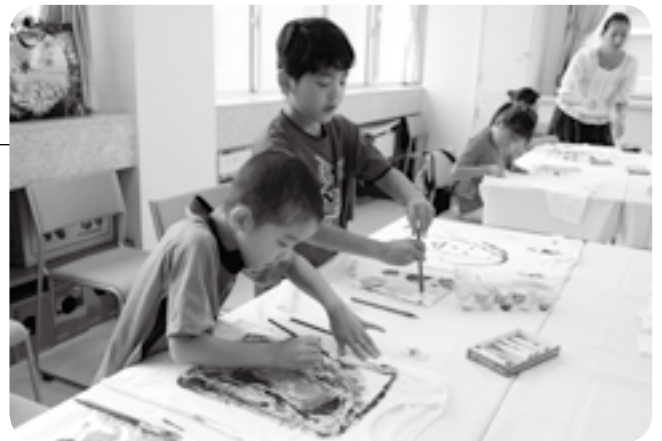
自分の好きな絵をTシャツに

虫刺されが気になる夏を快適に楽しんでもらおうと「虫よけTシャツを作ろう」が子ども館で行われました。参加した19人の子どもたちは、白いTシャツを持参し、アクリル絵の具で絵を描きました。乾燥後にエタノール、ハッカ油、精製水を混ぜた液をスプレーで吹き掛けて、虫よけTシャツが完成。効果は1日中持続します。ハッカには虫よけのほかリラックス効果があり、寝苦しい夏の安眠効果も期待できます。