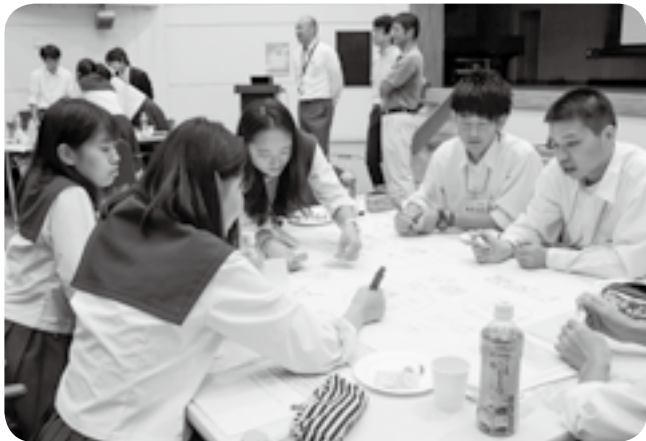
意見を書き込む高校生