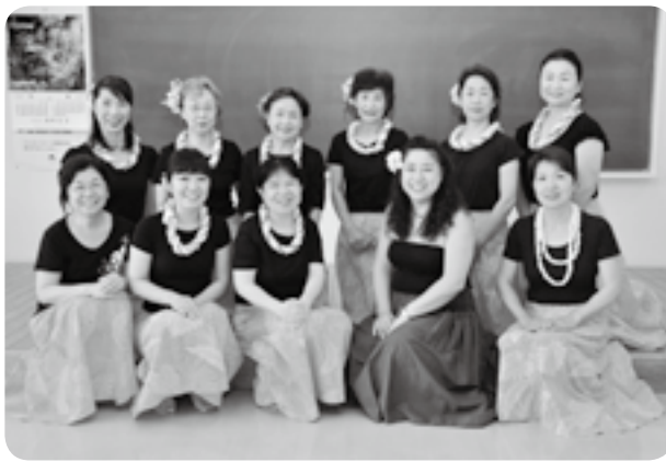
おそろいの衣装を着て

することが上達するコツだと思えます。また、自然や家族、土地への思いなどが込められた曲を一つの物語としてとらえ、振り付けの意味を考えながら踊ると、振り付けを忘れず