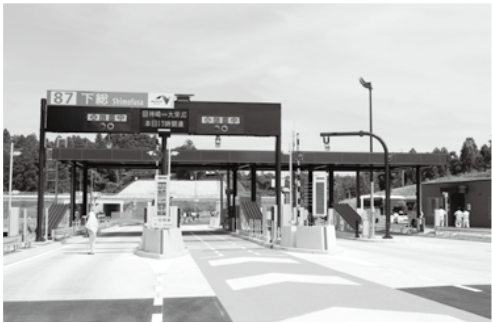
青山に整備された下総インターチェンジ