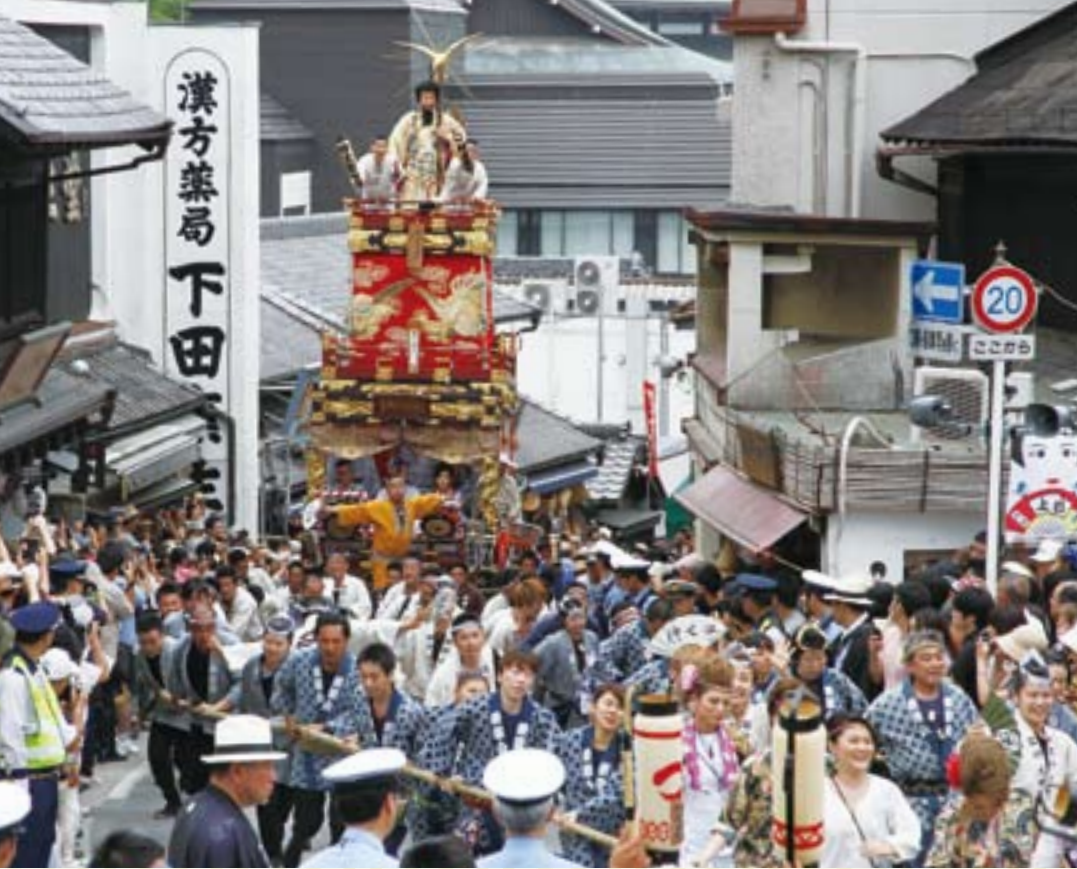
仲町の坂を駆け上がる仲之町の山車

成田祇園祭が7月10日(金)～12日(日)の3日間にわたり、成田山新勝寺や表参道を中心に開催されます。