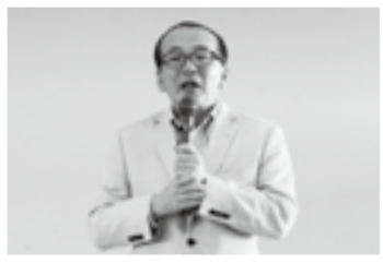
みらい☆デザイン会議であいさつ(6日)