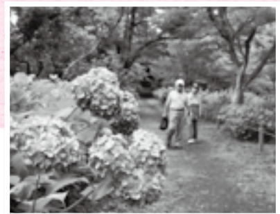
広大なアジサイ園を散策