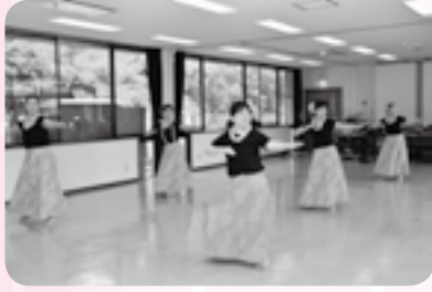
手の動きで波を表現

することが上達するコツだと思えます。また、自然や家族、土地への思いなどが込められた曲を一つの物語としてとらえ、振り付けの意味を考えながら踊ると、振り付けを忘れず