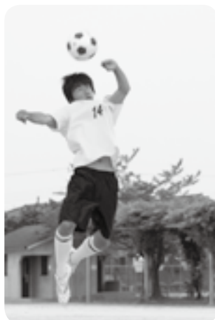
ボールにタイミングを合わせてヘディング