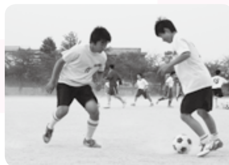
一対一は負けない