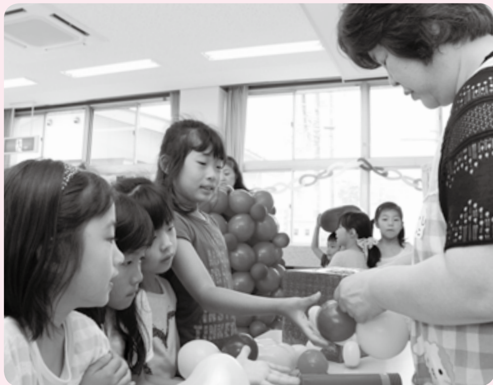
スタッフが作るバルーンアートに興味津々

赤ちゃんから高校生、保護者まで、世代を越えて多くの人たちが集まる子ども館。これから夏休みにかけて、イベントが盛りだくさんです。皆さん、遊びに来ませんか。