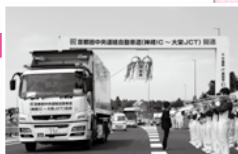
開通を記念して通り初めパレード

首都圏中央連絡自動車道(圏央道)の神崎インターチェンジ～大栄ジャンクション間が6月7日午後5時に開通し、東関東自動車道と常磐自動車道が圏央道で結ばれました。開通前には、下総インターチェンジで地元関係車両による通り初めパレードなどの開通セレモニーや、旧小御門小学校体育館で開通式典が行われました。圏央道の開通によって物流の効率化や人の交流が盛んになり、地域経済が活性化することが期待されます。