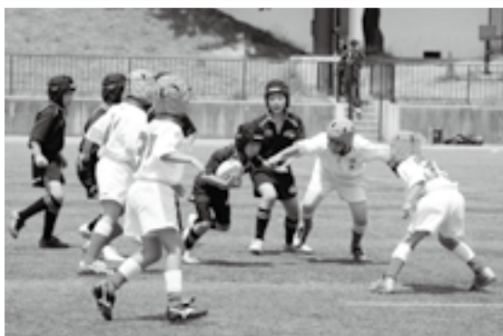
絶対突破してやる