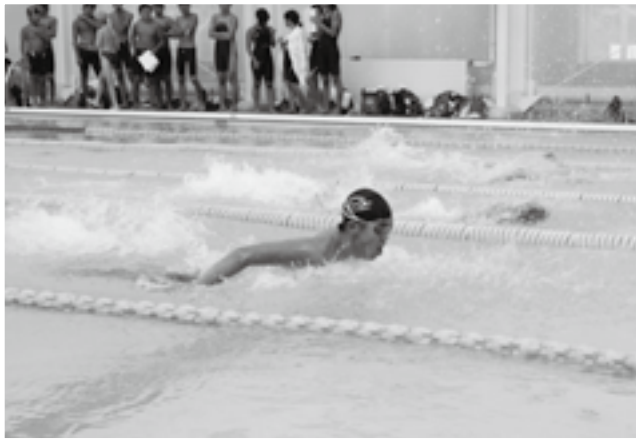
あと少し、がんばれ