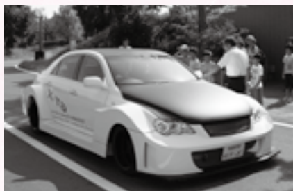
カスタムカーへ乗車

日時 =8月4日(火) 午前9時集合(午後3時30分解散) 集合場所 =市役所3階第二応接室 行き先 =市議会議場、鉄建建設建設技術総合センター、日本自動車大学校 対象 =市内在住の小学生と親 定員 =36人(初めての人を優先に抽選) 参加費 =無料(昼食は各自で用意) 申込方法 =7月8日(水)当日消印有効)までに、はがき・FAX・Eメールのいずれかで住所・氏名(フリガナ)・生年月日・電話番号を広報課(〒286-8585 花崎町760 FAX24-1006 Eメール koho@city.narita.chiba.jp)へ ※くわしくは同課(☎20-1503)へ。