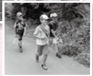
会話と笑顔は絶えることなく