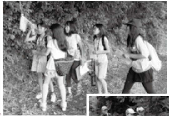
つるされた紙を発見

美郷台小学校をスタート・ゴールに、「成田ウォークラリー大会」が6月13日に行われました。浅間近隣公園、押畑街区公園などを通るコースは全長約4.5キロメートル。家族や友人2～5人でチームを組んだ参加者たちは、約90分かけて歩きました。6カ所に設けられたチェックポイントでは、「この周辺は古代に何と呼ばれていたでしょう」「砂場からカプセルを1つ選んで持ってきて」などの問題や課題をこなしました。また、5カ所につるされた紙に書かれている文字を組み合わせて言葉を作る指令も出されるなど、頭と体を存分に使って楽しみました。