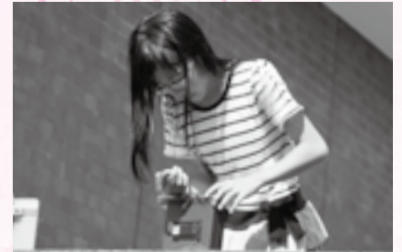
撮影は時間を計りながら

日時=8月4日(火)・5日(水) 午前10時~午後3時 会場=市立図書館2階視聴覚製作室 内容=ピンホールカメラを製作し、撮影と現像を行うことで、カメラの原理を学ぶ 対象=小学生(3年生以下は保護者同伴) 定員=各15人(先着順) 参加費=500円(材料費) 持ち物=昼食・飲み物・鉛筆・はさみ・セロハンテープ・ストップウォッチ(秒針付きの時計でも可)・エプロン ※申し込みは7月17日(金)までの午前9時30分~午後5時15分に視聴覚サービスセンター(☎27-2533)へ。