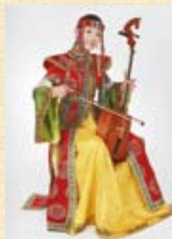
ヒーモリクラブ・シンシヤさん

編集後記のネタが見つからず悩んでいると、同僚が「こんなのどうですか」と見せてくれた一つの新聞記事。それは7月1日午前9時の直前に「うるう秒」の1秒が挿入され、その存廃が今世界で議論されているというもの。日ごろ、1秒を気にして生活している人がどれだけいるでしょう。でも、たかが1秒と侮ってはいけません。鉄道の運転士用時刻表は秒単位で設定されています。テレビやラジオも秒単位で番組が放送され、株価も秒単位で推移しています。知らず知らずのうちにわたしたちは秒単位の中で生活しているのです。もし廃止となっても、50年で35秒のズレが生じる程度。この1秒が無駄か有効か。時間に追われてばかりではなく、たまには時間について考えてみるのも良いのでは。