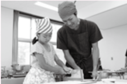
親子で協力して切ります

期日=8月23日(日) 時間=午後2時~5時の間の1時間 会場=成田公民館 対象=小学生と保護者 定員=15組30人(応募者多数は抽選) 参加費(1組当たり)=1,500円(材料費) 申込方法=7月28日(火)(必着)までに、はがきまたはEメールで住所・氏名(フリガナ)・電話番号・学校名・学年・教室名を中央公民館(〒286-0017 赤坂1-1-3 Eメールkominkan@city.narita.chiba.jp)へ ※くわしくは同館(☎27-5911、第1月曜日・祝日・7月21日(火)は休館)へ。