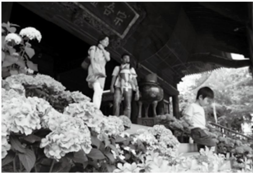
大本堂を参詣する人たち