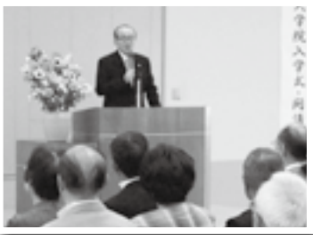
入学式・開講式であいさつ(9日)