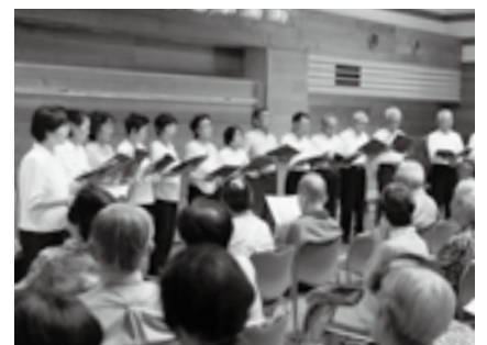
サークルが合唱を披露

日時 ＝6月6日(土) 午前11時15分から 会場 ＝豊住小学校体育館 対象 ＝9月15日現在、70歳以上で、案内はがきが届いた人 ※このほかの地区の敬老会については広報なりた9月1日号でお知らせします。くわしくは社会福祉協議会(☎27-7755)へ。