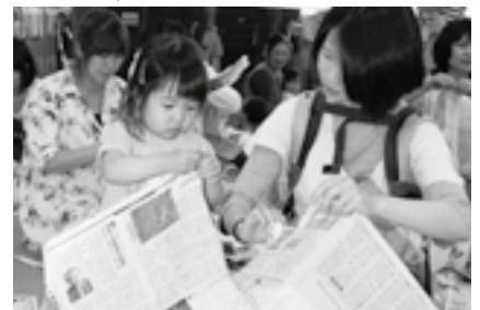
新聞紙もちぎれば遊び道具に

※申し込みは午前9時~午後5時に豊住公民館(☎37-1003、月曜日・祝日は休館)へ。