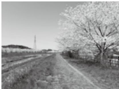
平成26年度に登録された取香川の景観