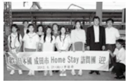
井邑市で歓迎を受ける訪問団

※国際情勢などにより、行程が中止または変更となる場合があります。くわしくは同事務局(☎23-3231)へ。