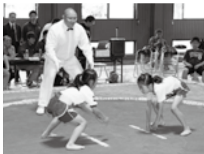
女の子も土俵で真剣勝負

※くわしくは月・水・金曜日の午前9時~午後4時に同会議所(☎23-1900)へ。