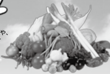
新鮮な野菜がそろう