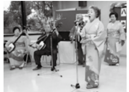
心の込もった歌声を客席に