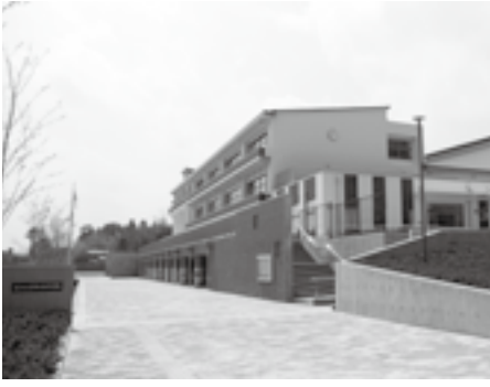
平成25年度に開校した公津の杜中学校