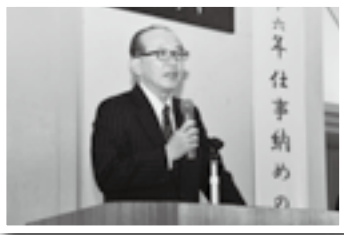
仕事納めの式であいさつ(26日)