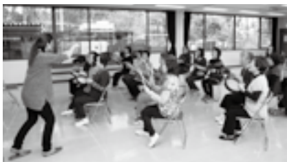
歌いながら合奏します