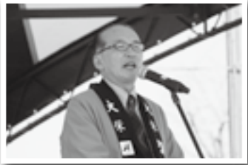
開会式であいさつ(23日)