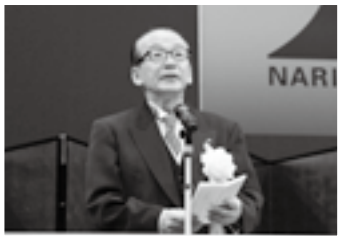
市制施行60周年記念式典であいさつ(1日)