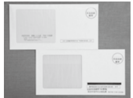
これらの封筒に見覚えはありませんか