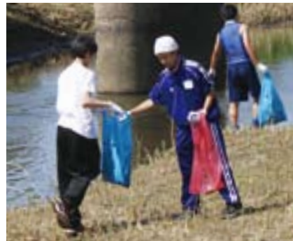
美しい成田を(根木名川みんなでおそうじ)