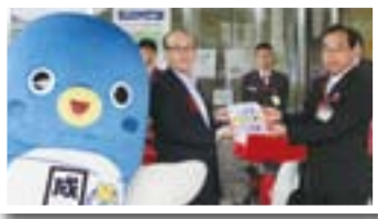
うなりくんのプレートと共に(1日)