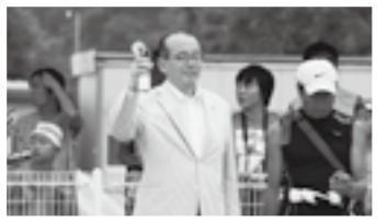
競技開始の合図を(19日)