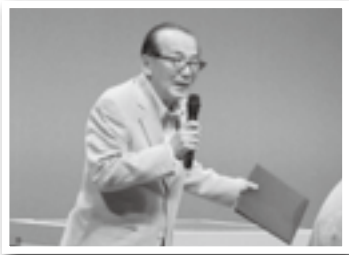
出張！なんでも鑑定団in成田であいさつ(21日)