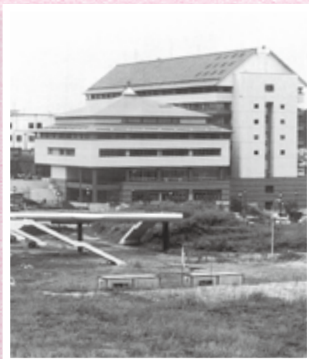
姿を現した市役所新庁舎と奥に見える旧庁舎。手前は工事中の京成成田駅東口