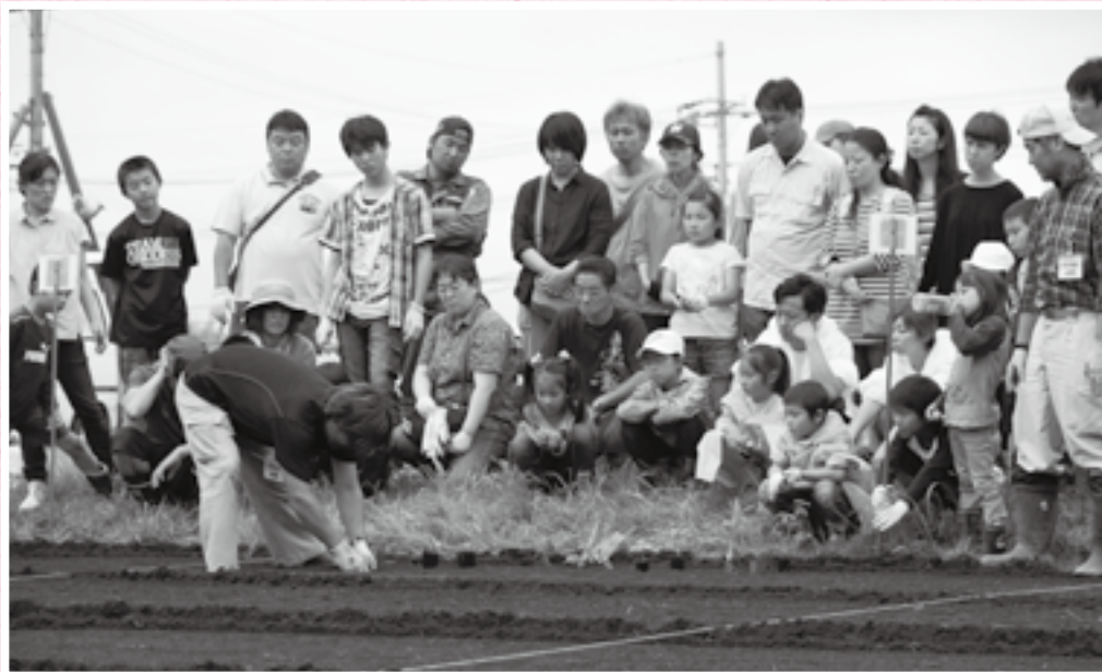
苗の植え方の実演に見入る参加者たち