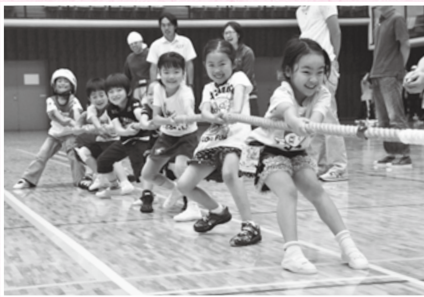
力いっぱい引っ張って