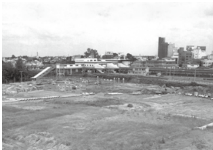
整備が進む国鉄(現JR)成田駅西口周辺