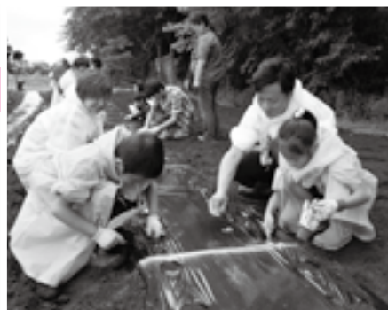
ラッカセイの種は植える深さに気を付けて

親子で農作物の植え付けや収穫など行い、農業に理解を深めてもらおうと6月8日、十余三地先の畑で「親子体験農業教室」が行われました。21家族100人の参加者は、若手農家の協力を得ながら、サツマイモやバジルの苗やラッカセイの種などの植え付けを体験。また、家族ごとに割り当てられた約20平方メートルの区画には、各自で用意してきたミニトマトやトウモロコシなどの苗や種が植えられました。参加者は収穫を心待ちに今後、割り当てられた区画の手入れを自ら行います。