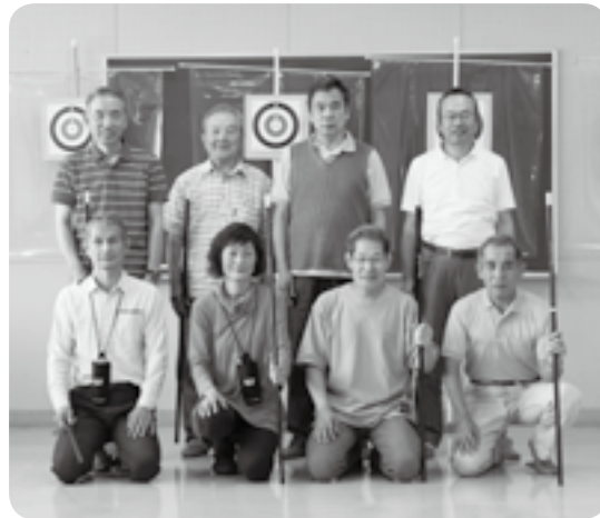
心地よい汗を流しませんか

は腹筋を使うのでカロリー消費に効果的。激しい動きはなくても、汗をびっしょりとかくほどです。普段の活動時間は3時間ほどで、個人練習を行います。集