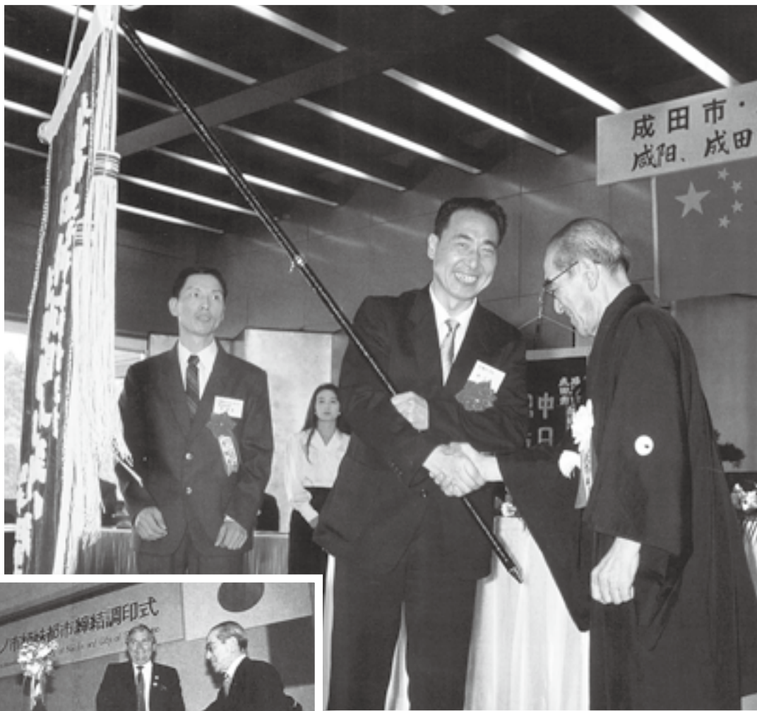
張市長(左)と固い握手を交わす長谷川市長