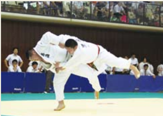
一瞬の隙を突いて(関東高等学校柔道大会)

高校生スポーツ最大の祭典「全国高等学校体育大会(インターハイ)」が、「君の汗輝く一滴勝利の雫」をスローガンの下、南関東4都県(東京都・千葉県・神奈川県・山梨県)を会場に開催されます。