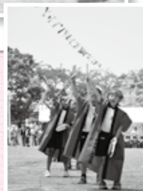
練習を重ねたエイサーを披露