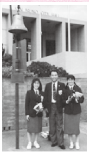
市内の中学生がサンブルーノ市を訪問