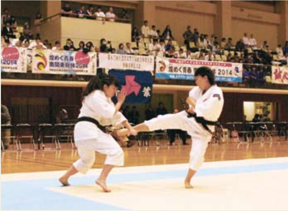
実戦さながらの演武を披露(県高校総体少林寺拳法競技)

全国高等学校総合体育大会(インターハイ)の柔道と少林寺拳法の2種目が、8月に本市で開催されます。皆さんの応援をお願いします。