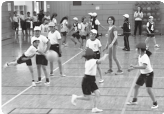
ボールに当たらないように素早く避けて

クラブではいろいろなゲームができて楽しいです。タグ取り鬼ごっこをもう1回やりたいです。