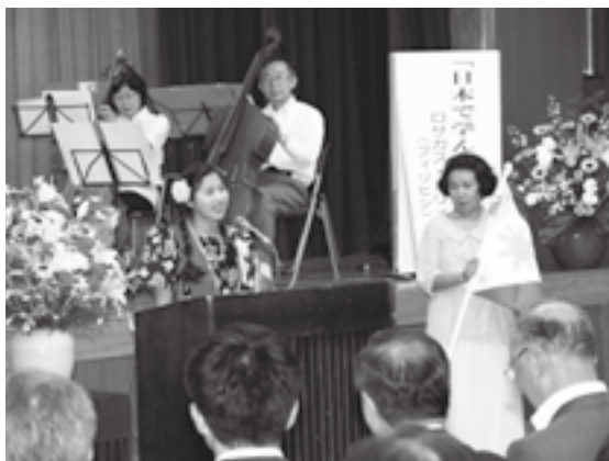
流ちょうな日本語で思いを語る