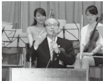
日本語スピーチ大会であいさつ(8日)