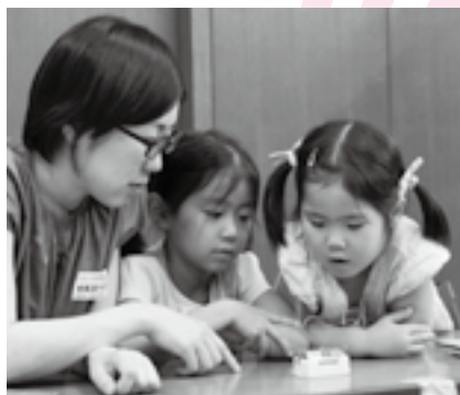
昨年はモータークリップを製作

日時=8月2日(土) 午後1時~4時 会場=中央公民館 内容=エレキギターの製作を通して、電気特性などを学ぶ 対象=小学生と親 定員=30組60人(応募者多数は抽選) 参加費(1組当たり)=600円(材料費・保険料) 申込方法=7月15日(火)(必着)までに、はがきに住所・氏名(フリガナ)・電話番号・学校名・学年・教室名を書いて中央公民館(〒286-0017 赤坂1-1-3)へ ※くわしくは同館(☎27-5911、第1月曜日・祝日・7月22日(火)は休館)へ。