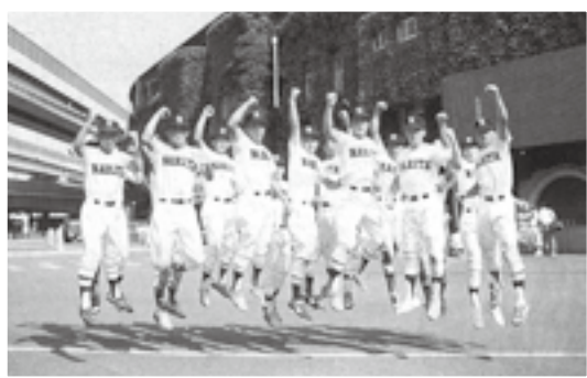
成高ナインが甲子園に出場