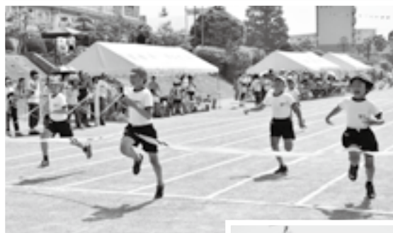
ゴール直前まで接戦

5月中旬～6月上旬にかけて、今まで運動会を秋に行っていた市内の小学校の多くで春季運動会が行われました。橋賀台小学校では5月31日、初夏にもかかわらず暑く照り付ける日差しの中、児童たちが応援団からのエール、観覧席からの保護者の声援を受けながら徒競走や障害物競走、玉入れなどに全力で取り組みました。また、中学年によるダンスの発表では日ごろの練習の成果を披露。保護者は「子どもたちが全員で動きをそろえて一つの曲を完成させたことに感動した」と話していました。