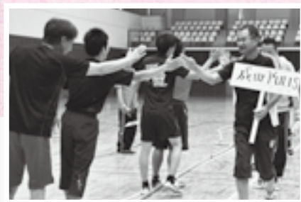
対戦後にはお互いの健闘をたたえ合う