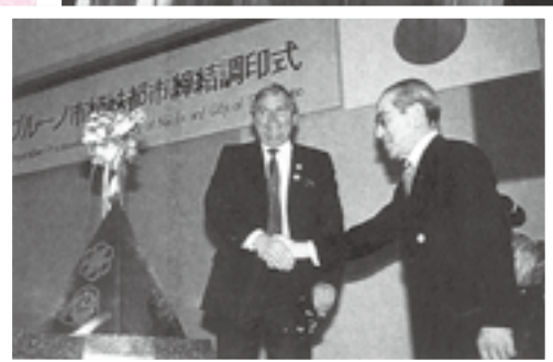
太平洋を越えた交流の始まり

市では国際空港都市にふさわしいまちづくりを目指し、昭和63年に中国・咸陽市、平成2年にアメリカ・サンブルーノ市と友好・姉妹都市を締結、交流を深めました。また、街並みも目覚ましい変貌を遂げていきました。