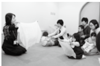
子どもと一緒に楽しんでください

※参加費は無料です。「なつやすみおはなし会」、「2・3歳のおはなし会」、「土曜日のおはなし会」への参加を希望する人は当日直接会場へ。くわしくは市立図書館(☎27-2000)へ。