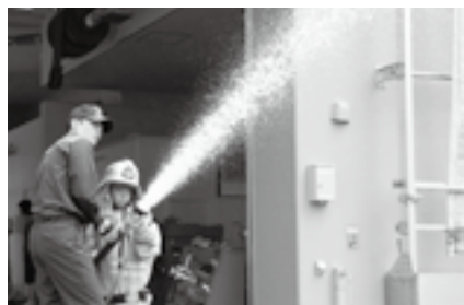
消防署で放水体験

申込方法=7月8日(火)(当日消印有効)までに、はがき・FAX・Eメールのいずれかで住所・氏名(フリガナ)・生年月日・電話番号を広報課(〒286-8585 花崎町760 FAX24-1006 Eメール koho@city.narita.chiba.jp)へ ※くわしくは同課(☎20-1503)へ。