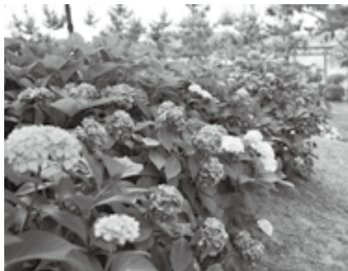
甚兵衛公園のアジサイ

平成6年、市制施行40周年を記念して「市の花」が、市民からの郵便投票の結果、アジサイに決まりました。選定理由には「花の姿が門前町成田にふさわしい」「印旛沼周辺などを中心に、市内のあちこちで植栽されている」などが挙げられました。