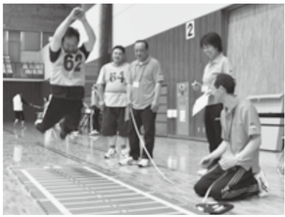
遠くを目指してジャンプ