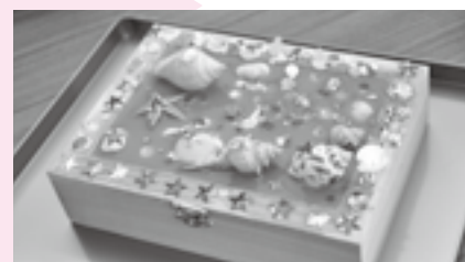
きれいに飾り付けよう

※申し込みは午前9時~午後5時に久住公民館(☎36-1646、月曜日・祝日・7月22日(火)は休館)へ。