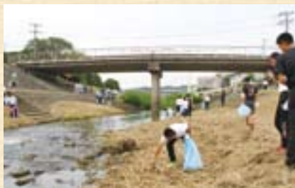
多くの人の協力できれいに