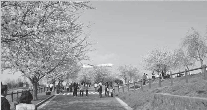
桜が咲き誇るさくらの山

市では、市民の皆さんに市内の施設や発展状況を紹介し、市政に対する認識と理解を深めてもらうと、毎年4回、施設見学会を開催しています。「施設見学会紙上ツアー」では、今までに見学した施設から、好評だった見学先にスポットライトを当て、皆さんに紹介します。