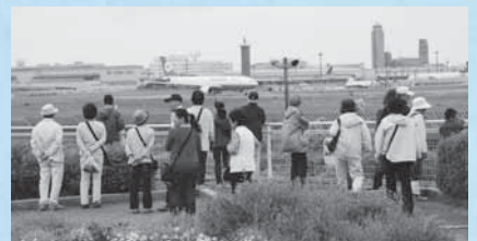
展望広場から飛行機の姿を望む参加者(平成24年5月15日の施設見学会)

間もなく「さくらの山」が1年で最も華やか季節になります。皆さんぜひおいでください。